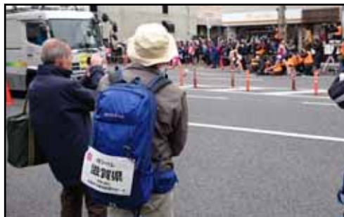
故郷ゼッケンつけて応援(平野神社前)

3人に抜かれ結局4位という残念な結果になってしまいました。でも、みんなよく頑張ってくれました。