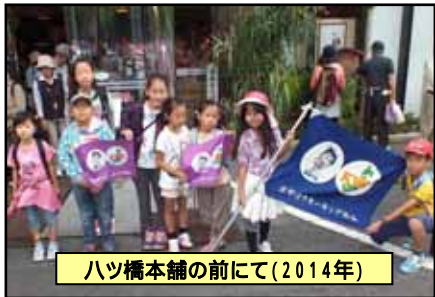
八ツ橋本舗の前にて(2014年)