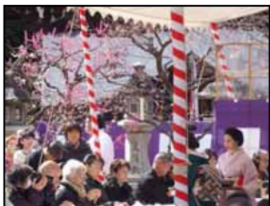
野点の宴(北野天満宮)

京都駅をスタート、鴨川河川敷をへて翔鸞児童公園に到着し、昼食後に北野天満宮へ向かいました。境内は満開の梅に包まれ甘い香りが漂っていました。上七軒のきれいどころの野点は大盛況、受験シーズンでもあり合格祈願の人々であふれていました。出店を冷やかし、お土産を手に天満宮を出発、JR円町駅にゴールしました。