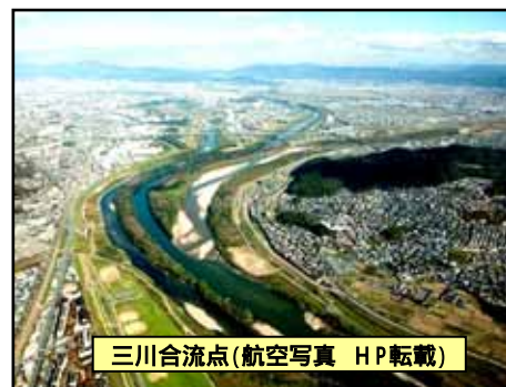
三川合流点(航空写真 HP転載)