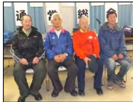
栄えある受賞者(3名)