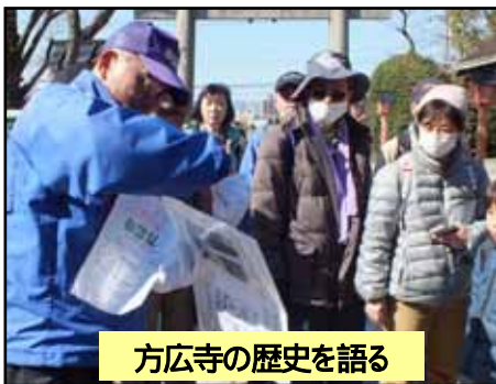
方広寺の歴史を語る

した二条城事件を、再び語り部が解説しました。大坂の陣が始まった時期の歴史遺産を巡ったウォークでした。