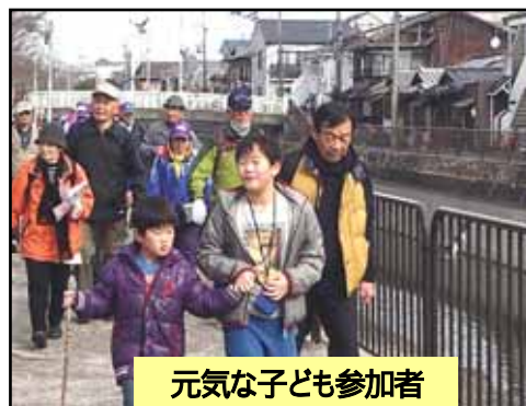
元気な子ども参加者

「京エコロジーセンター」に到着、ボランティアスタッフの方たちに、館内を案内していただき、エコロジーに対して再認識し意義深い見学でした。